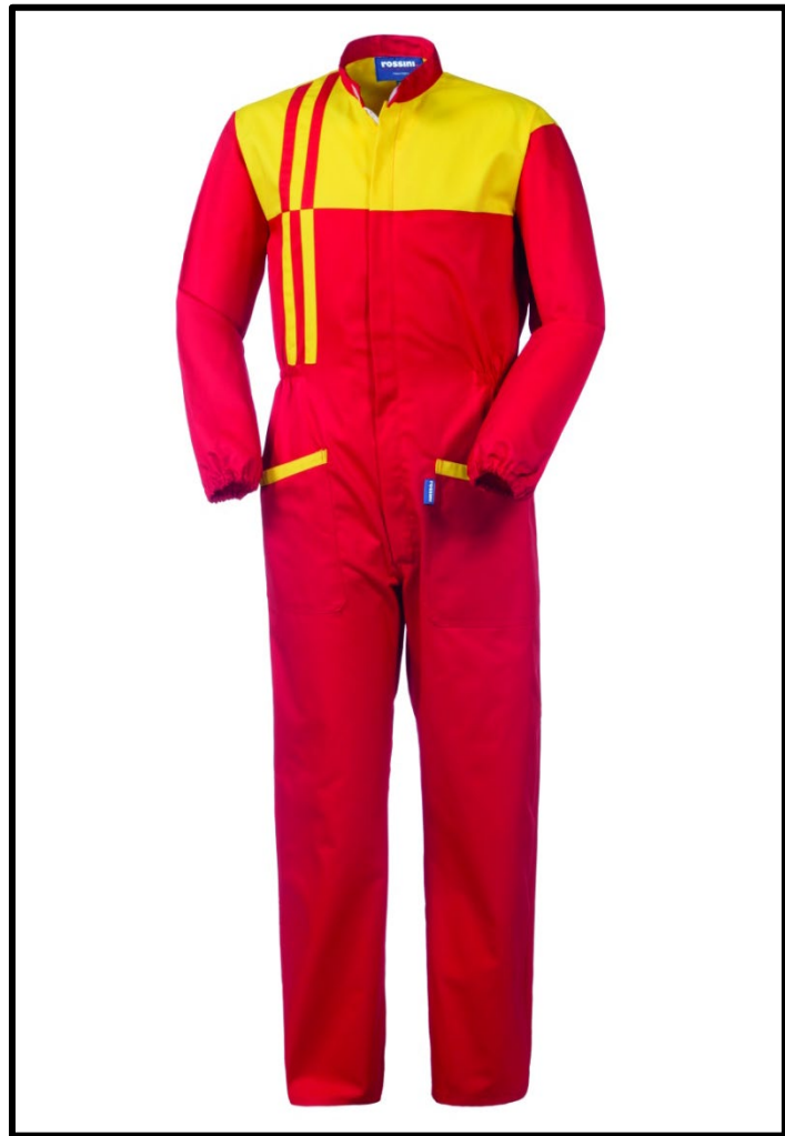
20 – ROSSO/GIALLO