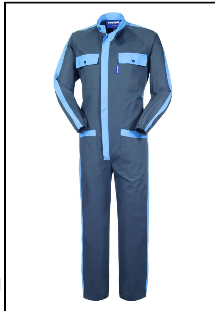
30 – GRIGIO/CELESTE